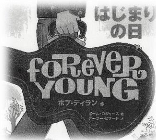
「はじまりの日」 ボブ・ディラン