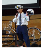
朝の登校時に、定期的にたつの警察署員の方に来ていただいています。今後も交通マナー向上に取り組んでいきます。